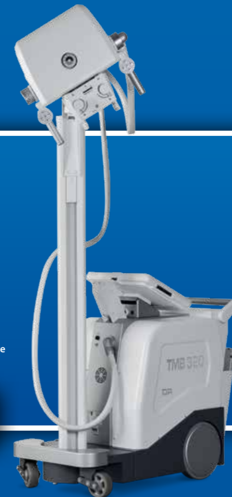
Ampia escursione verticale (569mm ÷ 2069 mm) Wide vertical excursion (569mm ÷ 2069 mm)