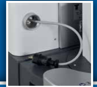
Avvolgicavo Cable reel