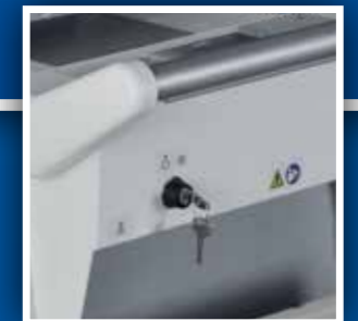
Chiave di sicurezza e masterizzatore DVD Safety key and DVD recorder

L'unità è destinata ad essere utilizzata principalmente per l'esecuzione di esami radiologici e indagini diagnostiche di: