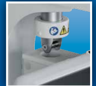
Sistema di bloccaggio elettrico e meccanico del braccio Electric and mechanical arm blocking mechanism