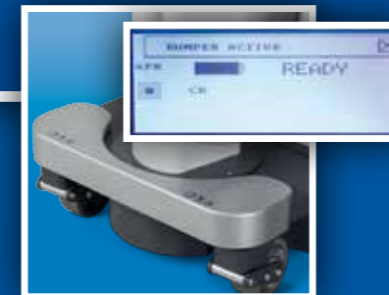
Sistema anticollisione Anticollision bumper