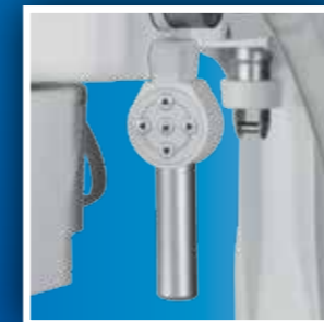
Comandi aggiuntivi per il posizionamento del letto del paziente Patient's bed fine adjustments command